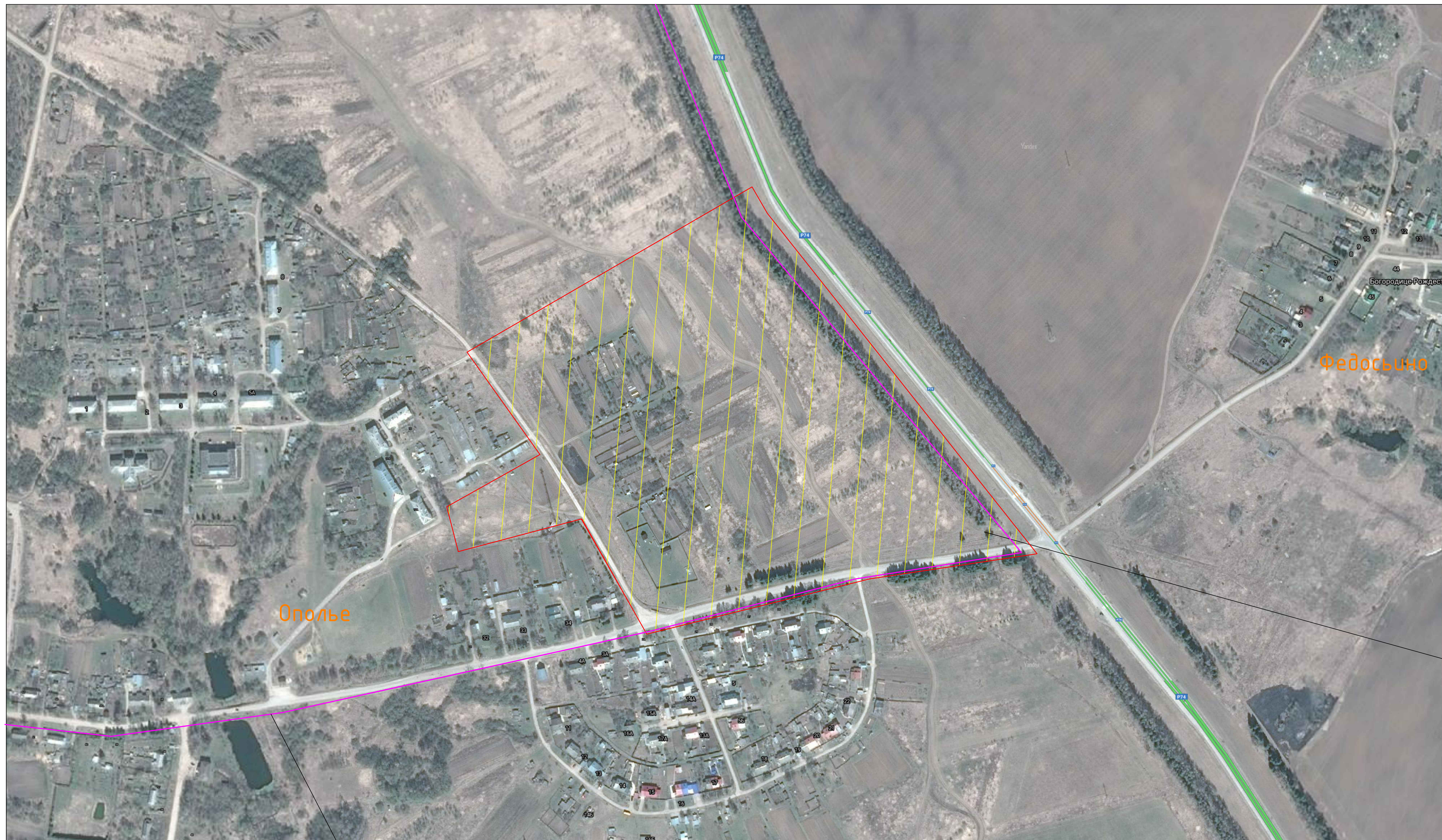
План М 1:2000