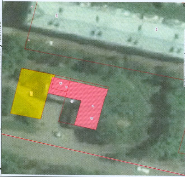
схема расположения земельного участка в окружении смежно расположенных земельных участков

-М - минимальный отступ от границ земельного участка в целях