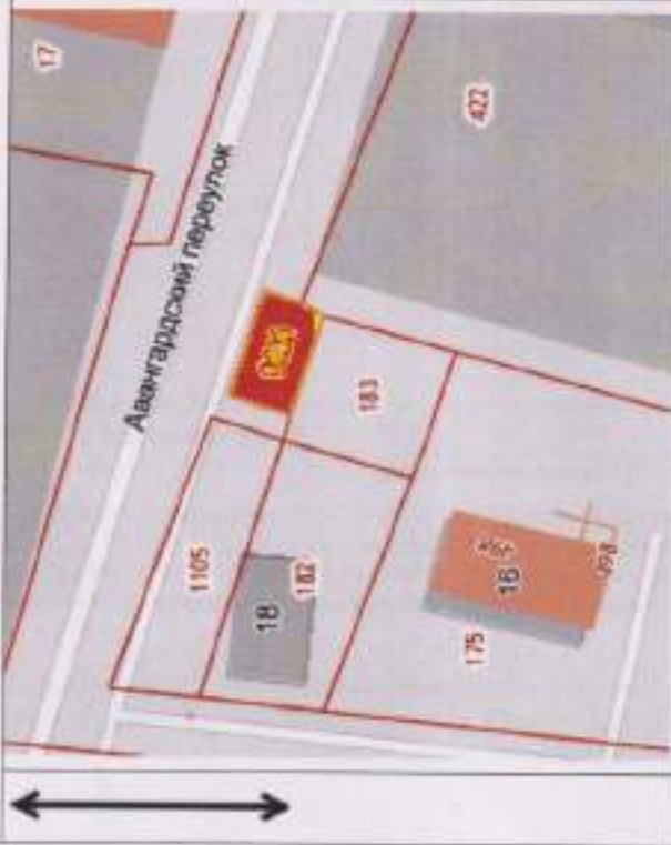
1. Чертеж(и) геостроительного плана земельного участка схема расположения земельного участка в окружении смежно расположенных земельных участков