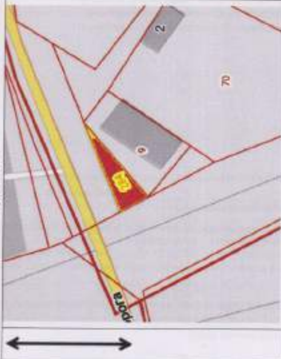
1. Чертеж(и) градостроительного плана земельного участка схема расположения земельного участка в окружении смежно расположенных земельных участков