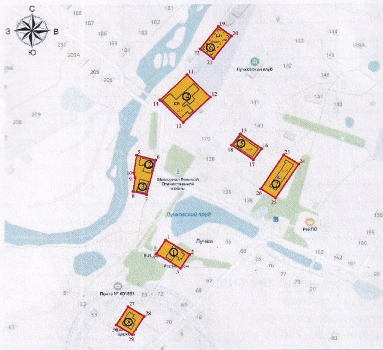
Карта (схема) границ территории объекта культурного наследия регионального значения «Ансамбль усадьбы Первушина», нач. XX в. (Юрьев-Польский район, местечко Лучки)

- от точки 30 до точки 27 (западная) – параллельно западному фасаду объекта культурного наследия «Здание школы (впоследствии – больницы)», нач. XX в., в 6 метрах к западу от него.