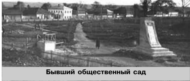
Бывший общественный сад

В 30-х годах XX века улица стала называться Ивановской. Возможно, это связано с тем, что в этот период город Юрьев-Польский вошел в состав Ивановской области.