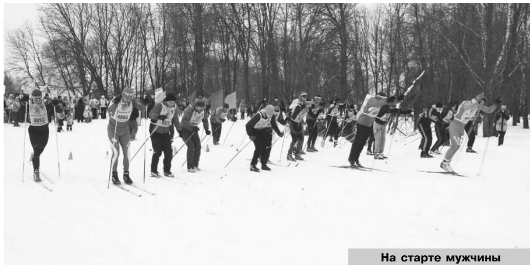
На старте мужчины