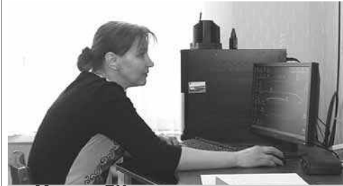
Многие ДК региона уже получили компьютерную технику

В скором времени компьютерную технику для работы получат также дома культуры Киржачского, Петушинского, Судогодского и других районов области.