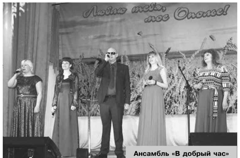
Ансамбль «В добрый час»

Милые женщины – труженицы завода «Промсвязь», позвольте поздравить вас с вашим замечательным праздником и выразить глубокую благодарность. На вашей мудрости, силе и терпении держится мир. Мы часто не замечаем, сколько прекрасных, умных, добросовестных, самоотверженных женщин работает среди нас.