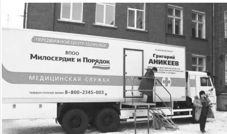
«Передвижные центры здоровья» – возможность пройти бесплатное обследование рядом с домом или работой

Григорий АНИКЕЕВ, депутат Государственной Думы РФ: «Принципиально важно, чтобы как можно больше людей смогли получить бесплатные консультации врачей и пройти обследования»