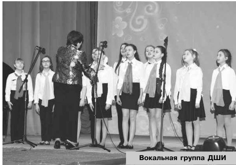
Вокальная группа ДШИ