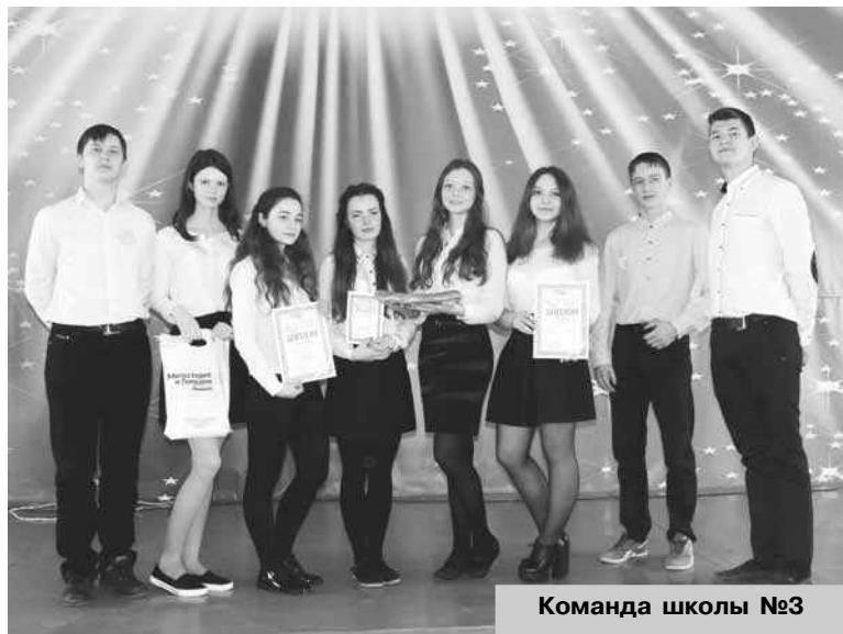
Команда школы №3