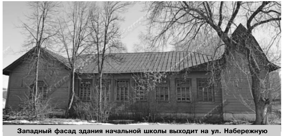
Западный фасад здания начальной школы выходит на ул. Набережную