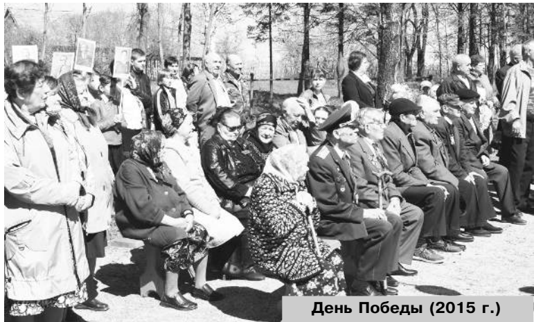
День Победы (2015 г.)