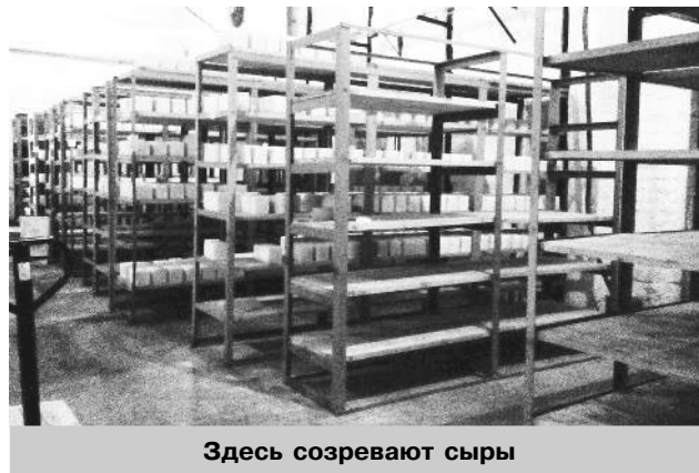
Здесь созревают сыры

Остановился докладчик и на работе строительного комплекса. Крупными и средними организациями за 2016 год выполнено работ на 50% больше, чем в аналогичный период прошлого года (82,2 млн рублей). Организации всех форм собственности, включая индивидуальных застройщиков, построено 103 новых квартиры общей площадью 11225 кв. метров, в том числе в сельской местности объем построенного жилья составил 6558 кв. метров, или 139,9% к 2015 году. Населением за счет собственных и заемных средств введено в действие 11024 кв. метров жилья (117,4% к 2015). Доля этих домов в общем объеме введенного жилья в 2016 г. составила 98,2%.