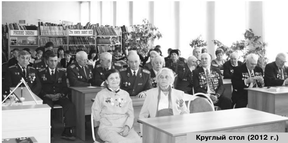
Круглый стол (2012 г.)

Мелькают годы, летят десятилетия, и наши вчерашние brave солдаты теперь выходят только к дому посидеть на лавоч-