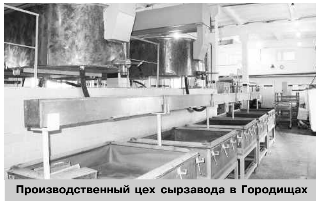
Производственный цех сырзавода в Городищах

ООО «Городищенские сыры» – развивающееся предприятие, которое специализируется на переработке молока и производстве сыра из натурального сырья. В 2016 году предприятие выпустило плавленые сыры, реализуемые крупным сетевым ритейлером. Также было освоено производство традиционного сладкосливочного масла. Но главное направление – это реализация проекта по импортозамещению твердых сортов сыра. В 2016 году предприятие отработало процесс производства сыров по швейцарской технологии и в январе 2017 наладило их выпуск. Уже освоено производство сыра «Чеддер», брынзы, в планах сыр «Маасдам», «Гауда» и другие. В рамках расширения производства в этом году предприятие планирует создать 30 дополнительных рабочих мест. Однако, получив поддержку проекта от Корпорации МСП в мае 2016 года и одобрение на финансирование в 201 млн рублей, предприятие за декабрь 2016 – апрель 2017 получило лишь 10 млн рублей кредитных средств. В настоящее время предприятию крайне необходимо пополнить оборотные средства, т. к. средний процесс созревания твердых сортов сыра – шесть месяцев. Для снижения издержек и себестоимости продукции нужно вложить немалые средства в газификацию.