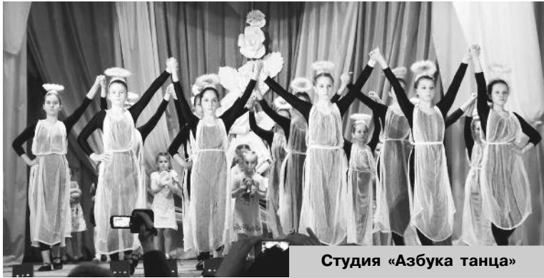
Студия «Азбука танца»

Перед открытием выставки членами жюри был определен