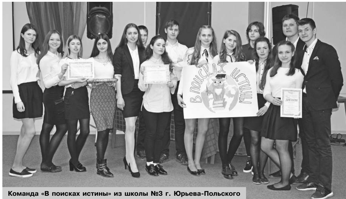
Команда «В поисках истины» из школы №3 г. Юрьева-Польского

гино, второе – из Данутинской школы, первое – из Судогды. Абсолютным победителем турнира и обладателем главного приза – познавательной экскурсии по Владимирской области – стала команда из Петушков.