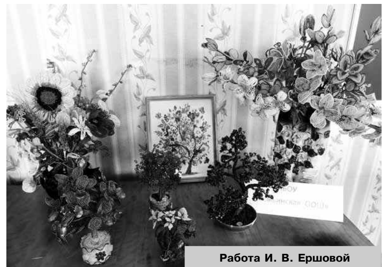
Работа И. В. Ершовой