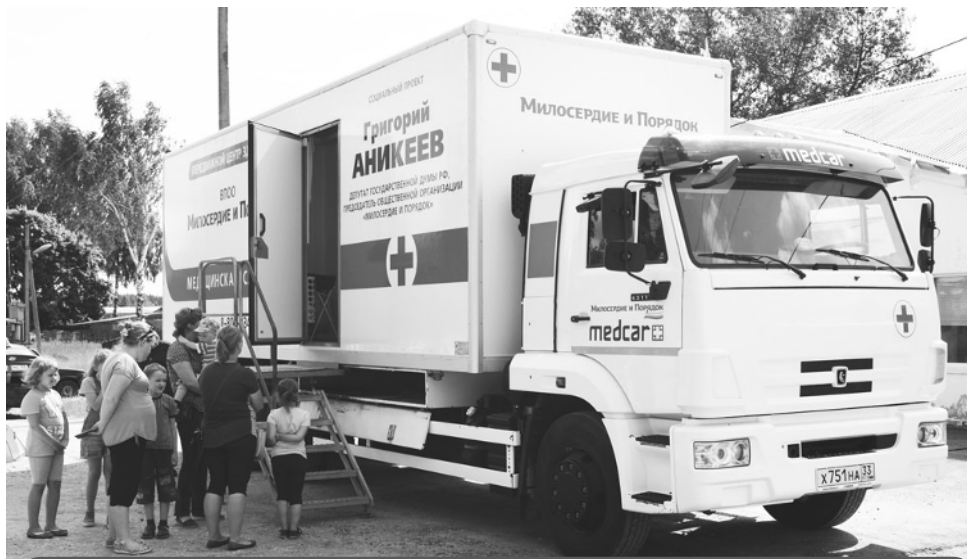
В Судогодском районе профилактический осмотр детей провели отоларингологи

Ознакомиться с графиком работы «Передвижных центров здоровья» можно на официальном сайте общественной организации «Милосердие и порядок» и в группах в социальных сетях. Записаться к врачу можно заранее по телефону бесплатной «горячей линии»: 8 (800) 23-45-003.