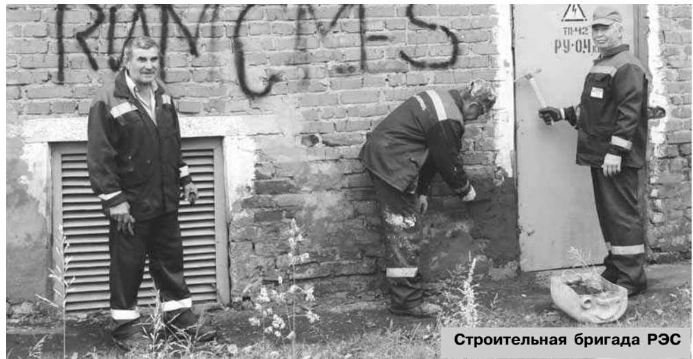
Строительная бригада РЭС