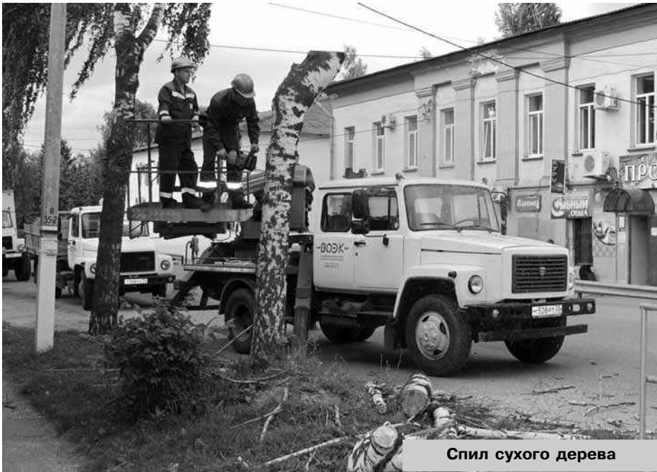
Спил сухого дерева