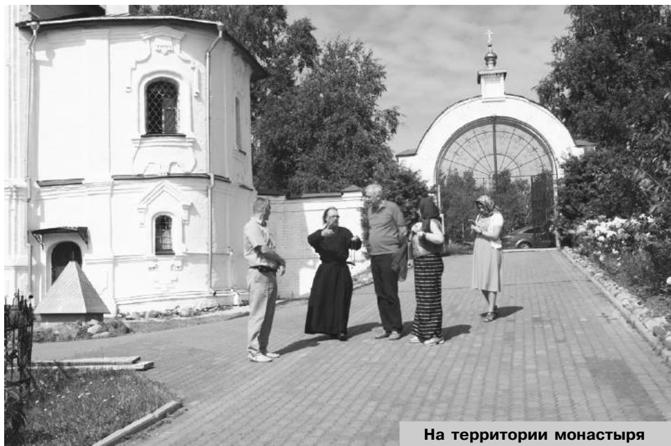
На территории монастыря