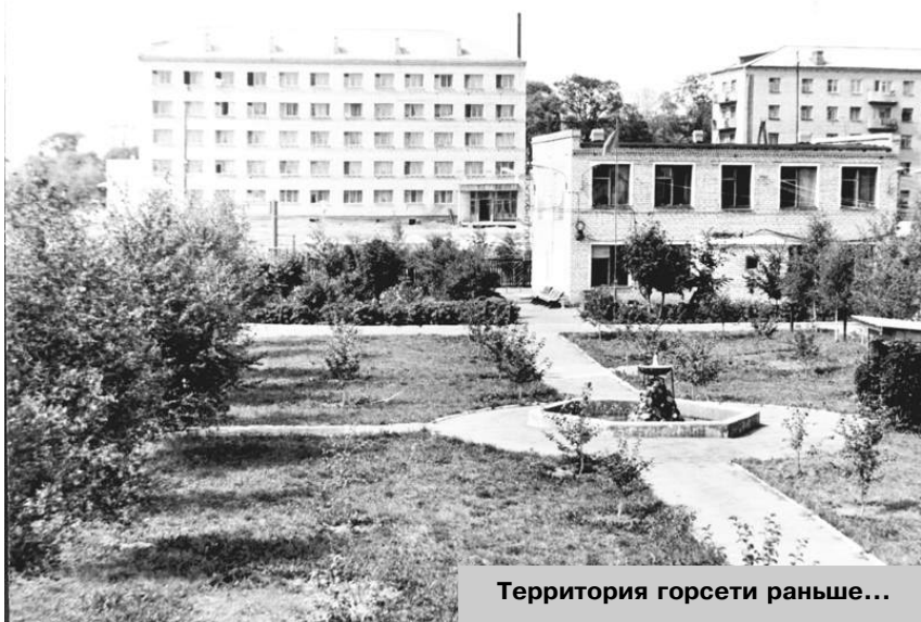
Территория горсети раньше...