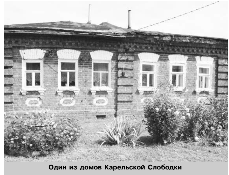
Один из домов Карельской Слободки

Пока члены комиссии набирали воду из источника Космы Яхромского, их поджидали в Карельской Слободке. Несмотря на то, что «зимующих» жителей здесь не осталось, каждое лето