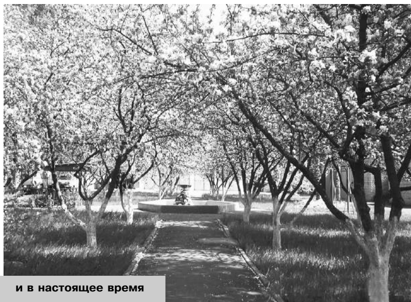
и в настоящее время