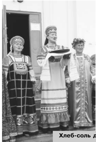
Хлеб-соль дорогим гостям