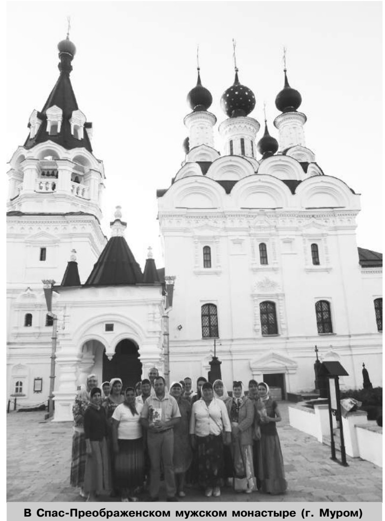
В Спас-Преображенском мужском монастыре (г. Муром)

Но вот время вошло в обычное русло и побежало вперед. Когда мы подъехали к Мурому, было уже почти семь часов вечера. Однако мы не могли проехать мимо святых благоверных Петра и Февронии: с благоговением приложившись к их святым мощам, находящимся в Свято-Троицком женском монастыре. В Спасо-Преображенском мужском монастыре успели на помазание, а главное – приложились к Животворящему Кресту Господню! Вы спросите, устали ли мы? Не то слово! Но уста-