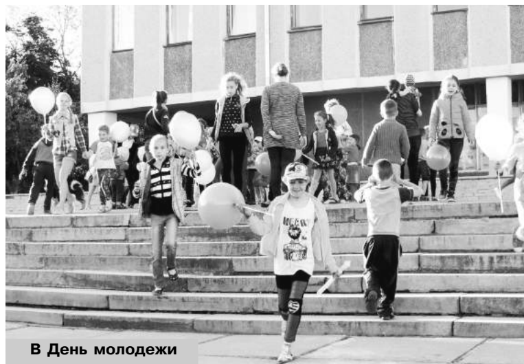
В День молодежи