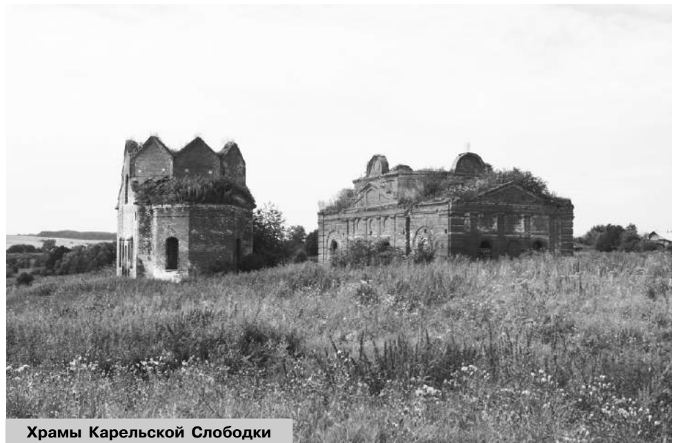
Храмы Карельской Слободки