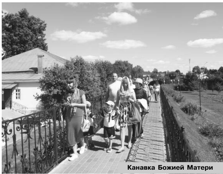
Канавка Божией Матери

Марина ХУДЯКОВА.