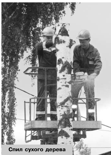
Спил сухого дерева

К концу века количество трансформаторных подстанций возросло с 18 до 44, питающих фидеров 10 кВ — с 2 до 7,