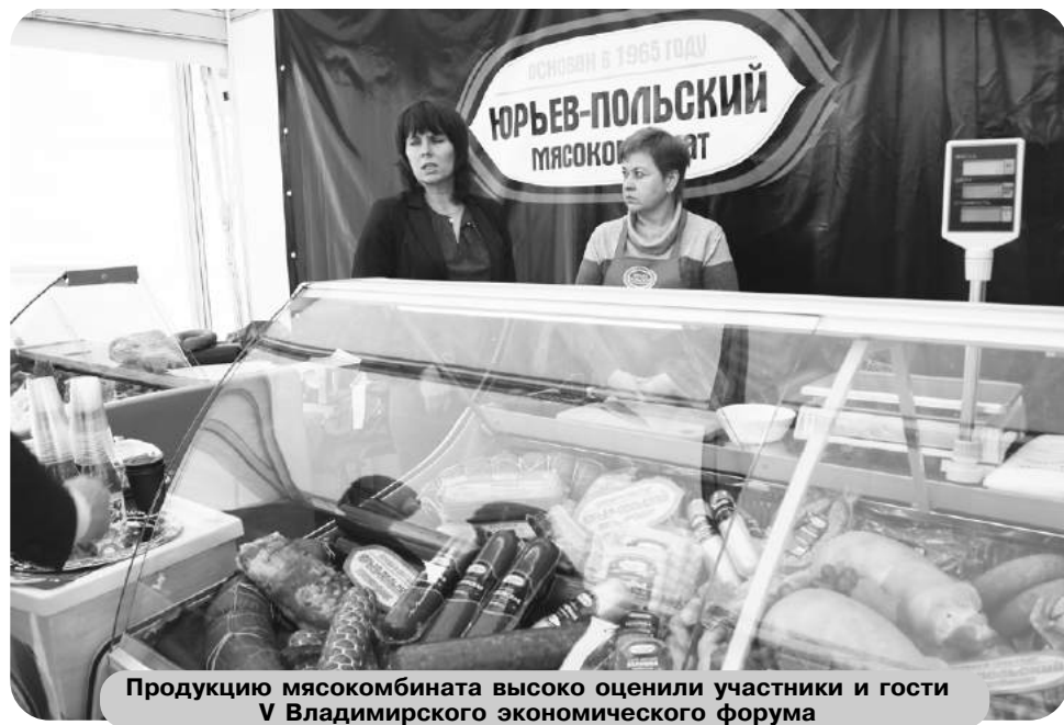
Продукцию мясокомбината высоко оценили участники и гости V Владимирского экономического форума

– Рынок мясных изделий и колбасной продукции – высококонкурентный. Наши покупатели разбираются в качестве продукции, поэтому, чтобы занять на нем свою нишу, мы стараемся предложить наиболее качественный продукт за оптимальную цену. Конечно, мы учитываем покупательскую способность населения Владимирской области при формировании цен. Для нас важным является не сверхприбыль, а доверие наших покупателей. Поэтому мы стараемся производить качественную продукцию за ту цену,