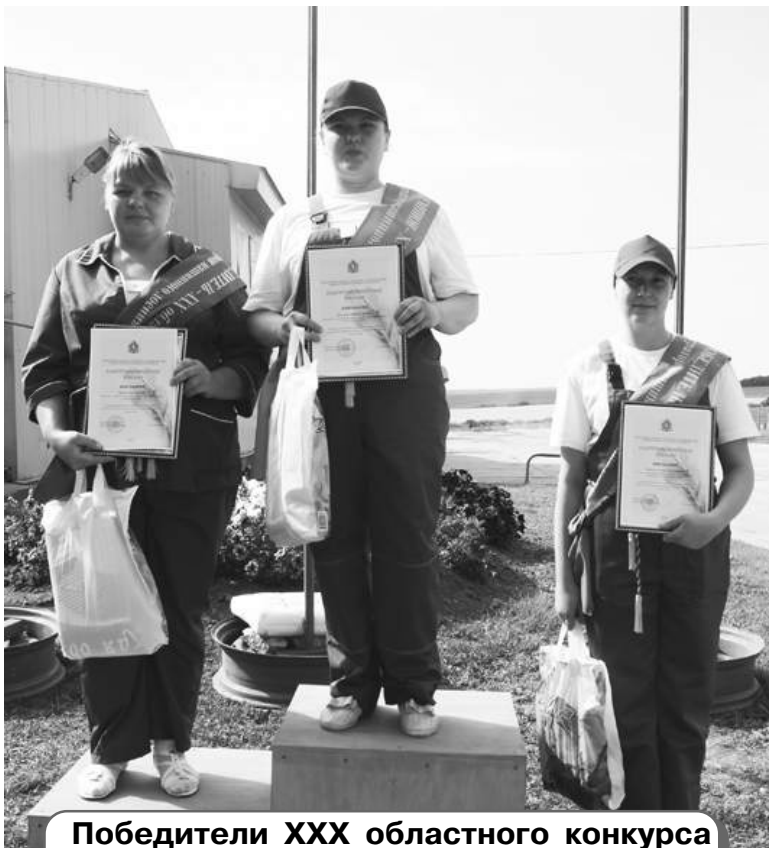
Победители XXX областного конкурса мастеров машинного доения коров. (Подробности – на 2-й стр.)

Общественно-политическая газета Юрьев-Польского района