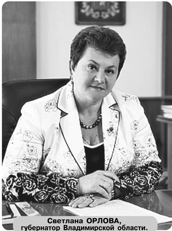
Светлана ОРЛОВА, губернатор Владимирской области.