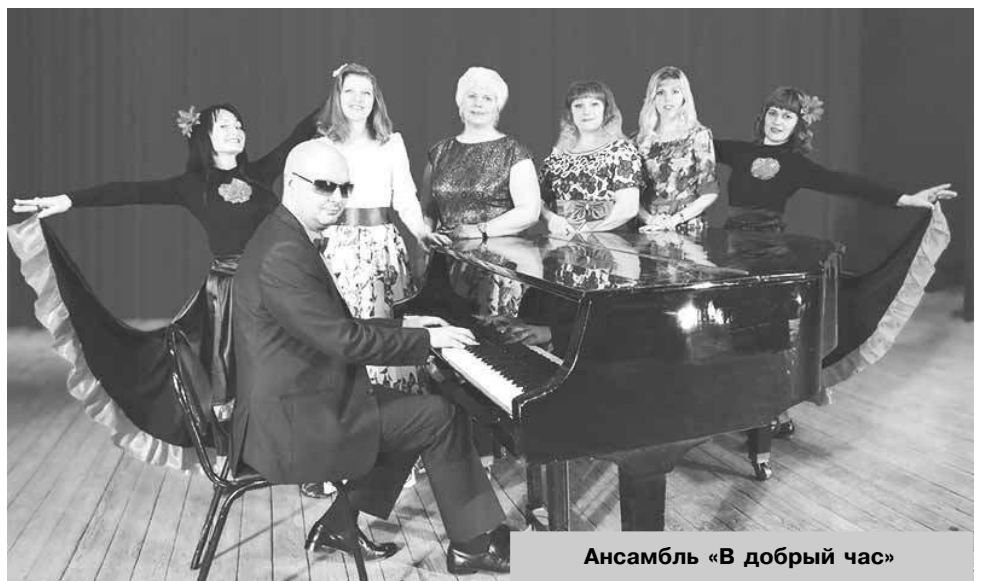
Ансамбль «В добрый час»