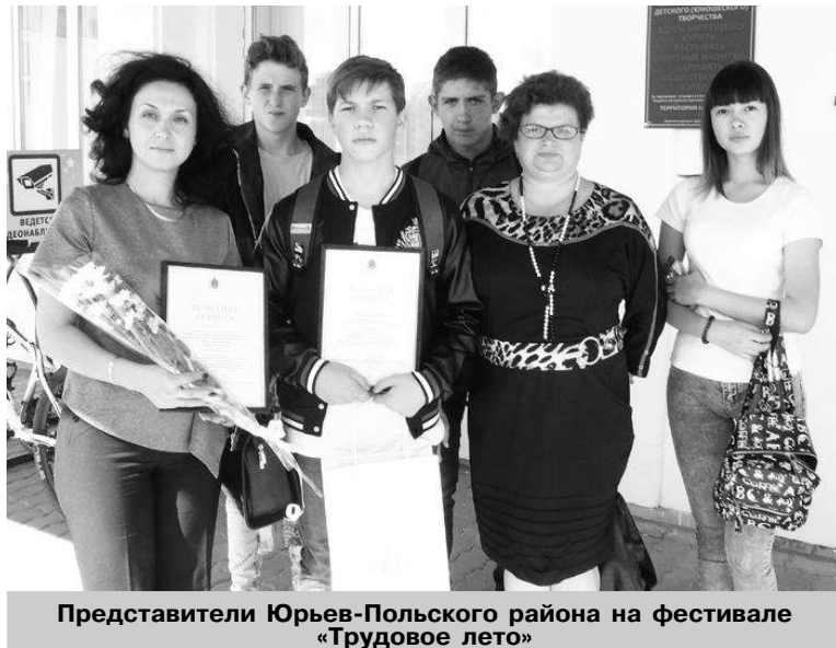
Представители Юрьев-Польского района на фестивале «Трудовое лето»