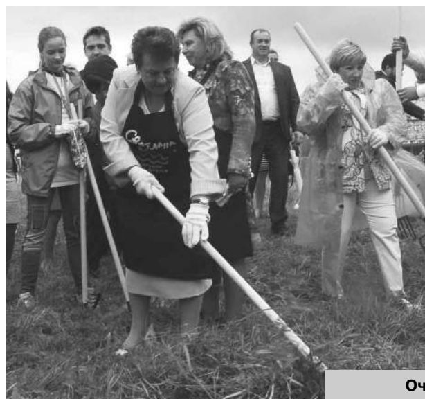
Очистка берега Нерли

Светлана Орлова рассказала о проводимой в регионе кампании по очистке малых рек, в числе которых Серая, Судогда, Каменка. И это только начало, считает губернатор. «Россия всегда была водной державой. Очень важно, что в акции Минприроды участвует общественность, жители с самого юного возраста. Каждый из нас: и наши граждане, и общественность, – должны занимать в этих вопросах самую активную позицию», - подчеркнула Светлана Орлова.