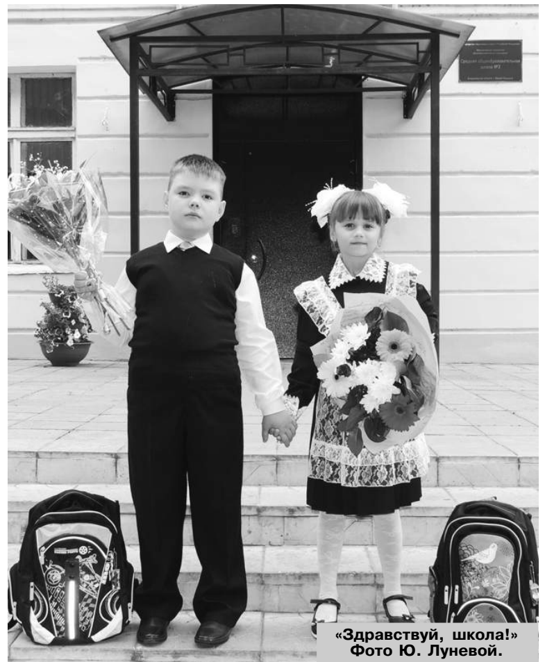
«Здравствуй, школа!»

Глава 33-го региона рассказала о работе по совершенствованию инфраструктуры системы образования региона. За три года во Владимирской области было построено 12 новых, ре-