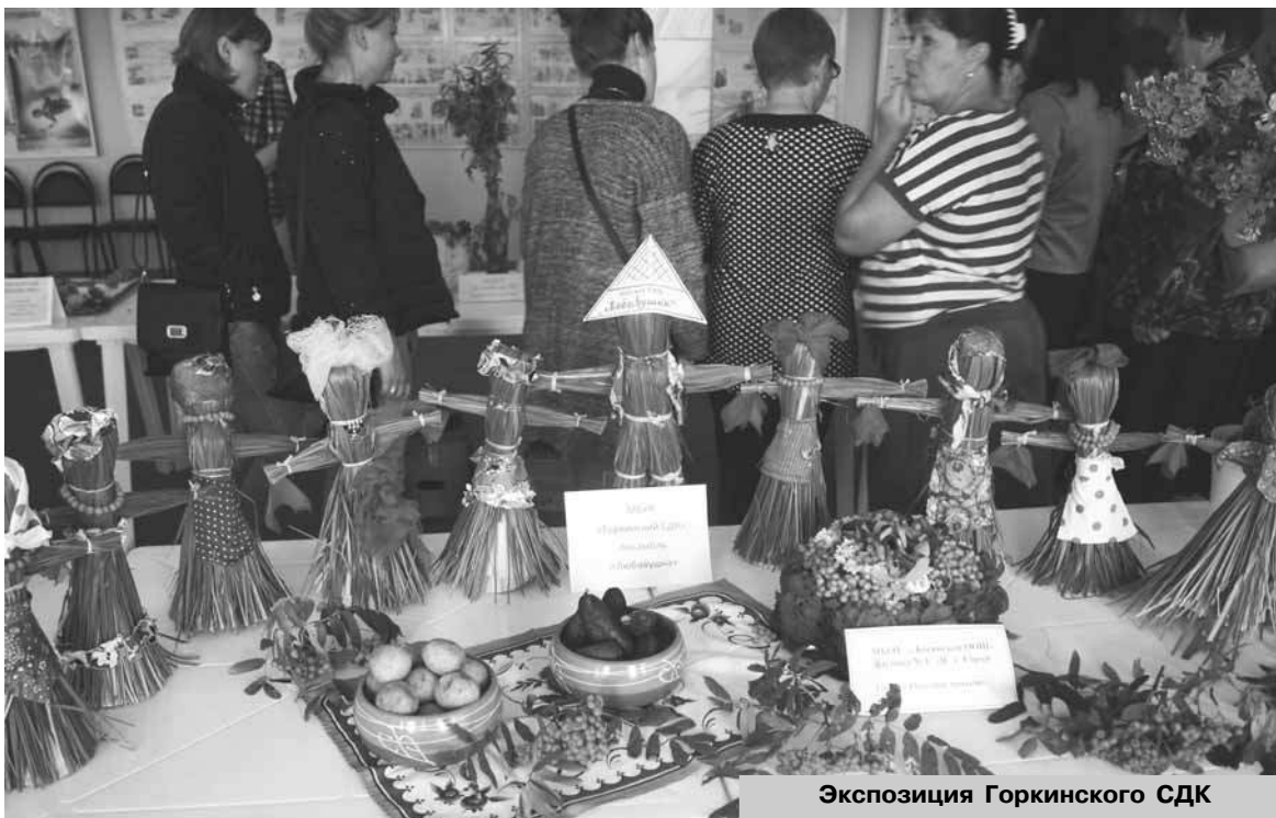
Экспозиция Горкинского СДК