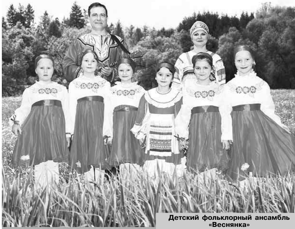
Детский фольклорный ансамбль «Веснянка»

Уважаемые жители города, МБУК «Районный центр культуры и досуга» сердечно поздравляет вас с 865-летием нашего древнего города Юрьева-Польского! Какими бы разными мы ни были, как бы ни складывались наши судьбы, всех нас объединяет любовь к нашему общему дому, участие в его судьбе, неравнодушие к облику и традициям. Желаем нашему городу дальнейшей развития и процветания, а мы, работники культуры, в свою очередь, постараемся радовать вас яркими выступлениями, интересными проектами и новыми творческими достижениями, отдавая частичку своего сердца, тепло своей души, вкладывая всю свою энергию и талант для того, чтобы сделать нас сыщнее и разнообразнее культурную жизнь города.