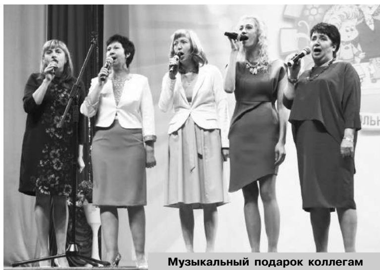
Музыкальный подарок коллегам