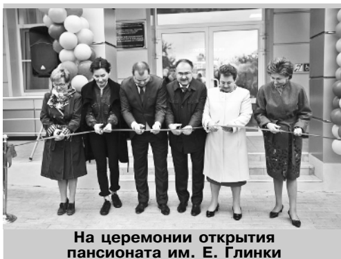
На церемонии открытия пансионата им. Е. Глинки

Пансионат стал четвертым по счету учреждением, открытым в 33-м регионе в рамках федерального проекта партии «Единая Россия» «Старшее поколение», координатором которого является Галина Карелова. Выступая перед гостями праздника, она подчеркнула: «Это боль-