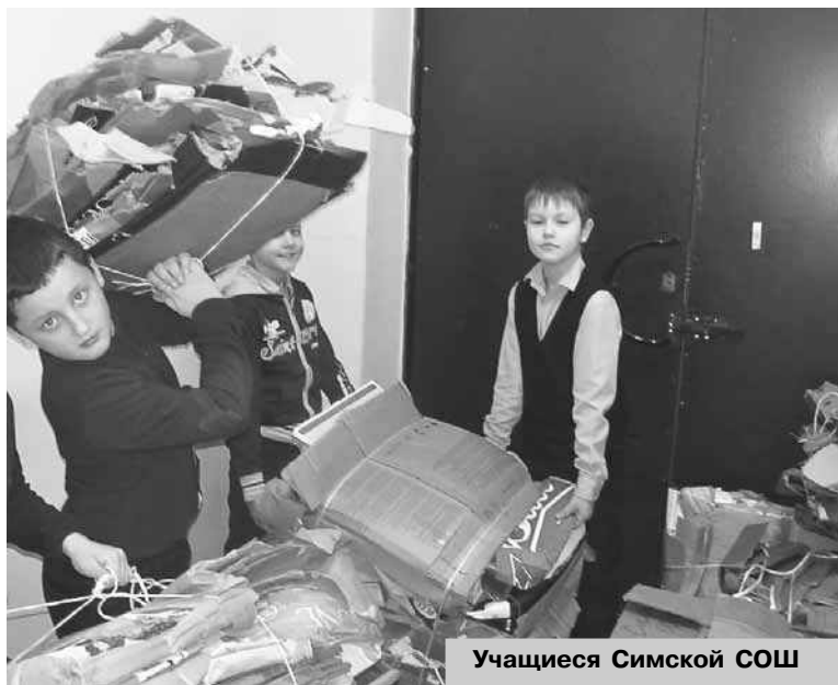
Учащиеся Симской СОШ