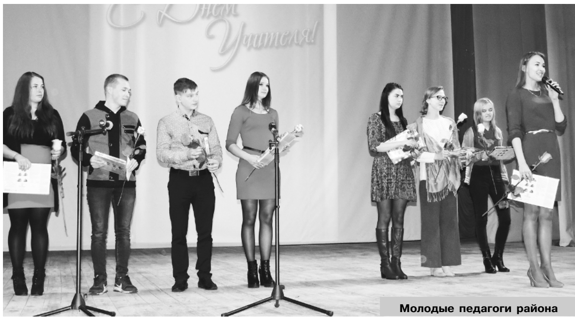
Молодые педагоги района