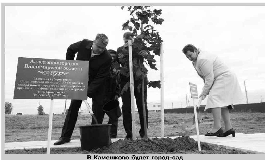
В Камешково будет город-сад

Важным направлением деятельности предприятия в ближайшей перспективе станет выпуск колесных тракторов «Владимир» с дизельным двигателем мощностью 50 лошадиных сил – ожидается, что к 2020 году «КаМЗ» будет выпускать 1000 тракторов в год. В среднесрочной перспективе планируется реализация инвестиционного