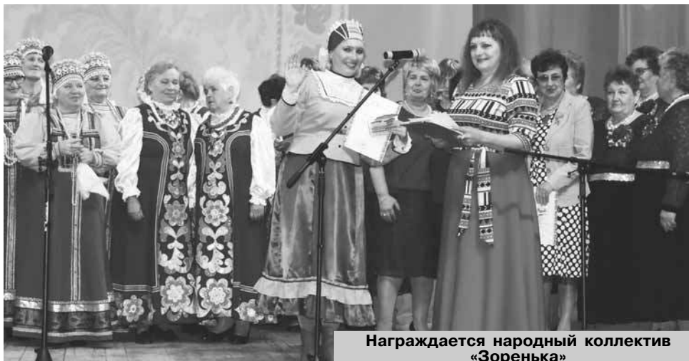
Награждается народный коллектив «Зоренька»