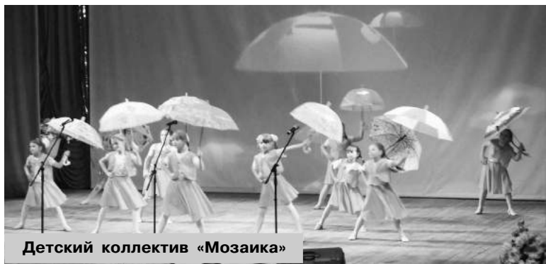
Детский коллектив «Мозаика»