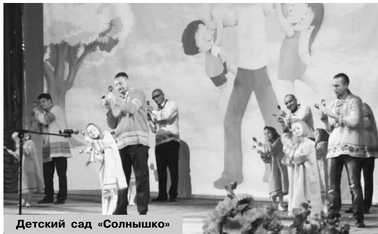
Детский сад «Солнышко»