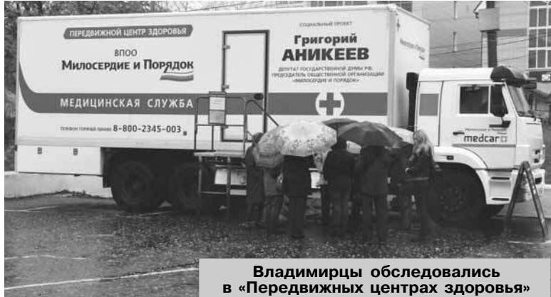
Владимирцы обследовались в «Передвижных центрах здоровья»

График выездов медицинских центров опубликован на сайте общественной организации «Милосердие и порядок», в районных газетах и в соцсетях. Записаться на консультацию можно заранее по телефону бесплатной горячей линии 8-800-2345-003.